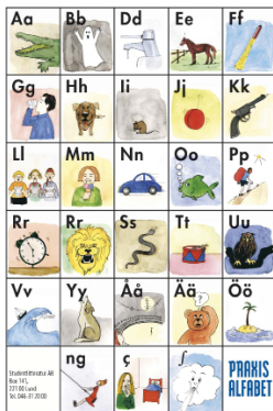
Praxis vykort (12 st)