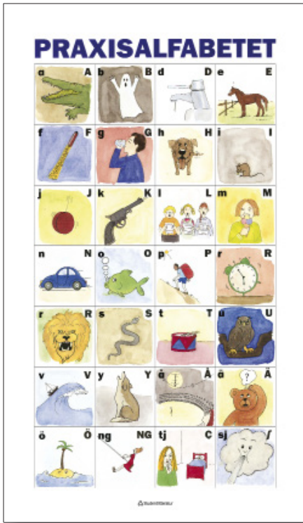
Praxis affisch (1 st)

På affischen finns färgbilder med hela fonemalfabetet. Den kan hängas på väggen och kan också lamineras, klippas isär och användas som småkort.